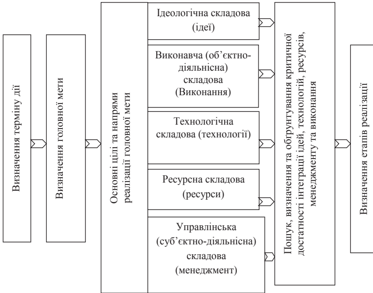
Рис. 5.1. Спрощена технологічна схема розробки концепцій за принципом досягнення самоорганізаційної спроможності розвитку [33]

– необхідність дотримання та вдосконалення управлінської культури та ін. [33] (рис. 5.1).