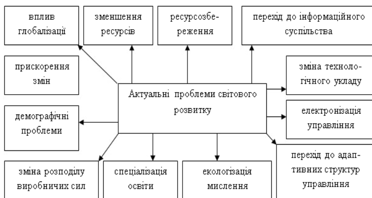
Рис. 5.2. Актуальні проблеми світового розвитку

Важливою складовою частиною сучасного управління є управлінська культура, основними елементами якої є метод і стиль управлінської діяльності. Управлінська культура проявляється через комплекс уявлень про систему цінностей і цілі організації, в ставленні до справи, в правилах й нормах ділової поведінки, і, як наслідок, у характері та змісті управлінських рішень і відповідних управлінських впливів. Одним з проявів сучасного стилю управління на публічному рівні є реалізація функції зв'язків з громадськістю, тобто інформування останньої про свою діяльність та з'ясування оцінювання нею цієї діяльності. Іншим прикладом є надання управлінню демократичного характеру.