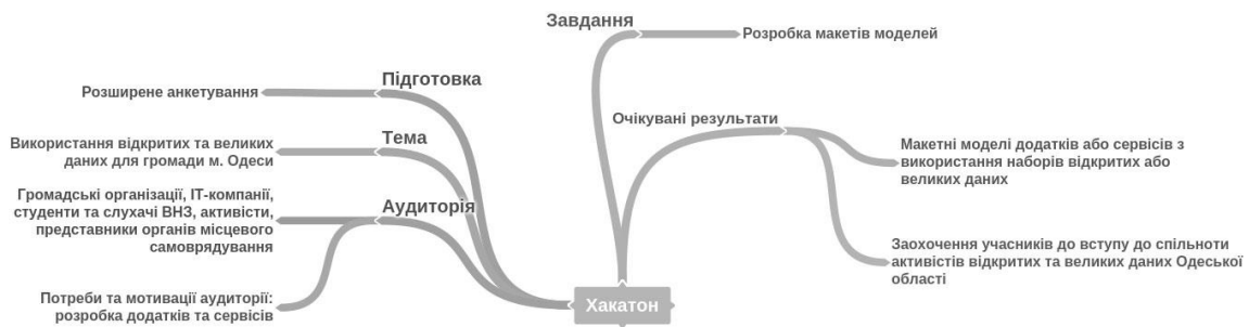
Рис. 4. Стислий опис хакатону у сфері відкритих даних.

Міжнародна дорожня карта 2015 з першим планом дій була початковою спробою спрямувати міжнародну спільноту на активізацію роботи уряду, громадянського суспільства, наукових кіл та приватного сектора у напрямі глобальних відкритих даних для розкриття їх потенціалу. У Міжнародній дорожній карті 2016 підкреслюється, що центр уваги у сфері відкритих даних зміщується до створення спільнот відкритих даних для того, щоб дані дійсно стали корисними у вирішенні безлічі проблем, які стоять перед громадянами та урядами країн у всьому світі [10]. Другий план дій з міжнародного співробітництва у сфері відкритих даних націлений на розширення співпраці як на глобальному, так і регіональному рівнях. Не важко зробити порівняння між дорожніми картами та визначити на якому етапу розвитку відкритих даних знаходиться Україна.