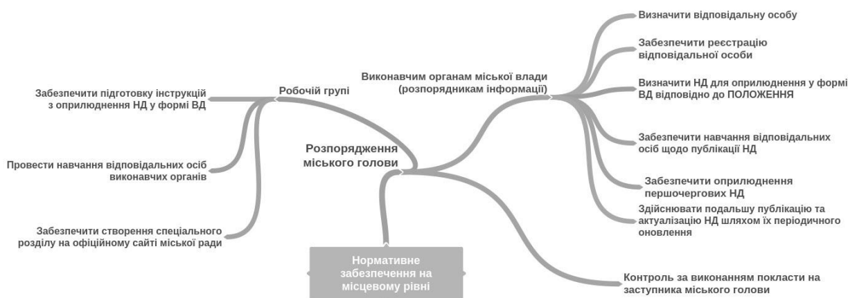
Рис. 1. Алгоритм дій з оприлюднення публічної інформації у формі відкритих даних на місцевому рівні на прикладі розпорядження міського голови.

технологій, розпорядження міського голови, регламент, інструкції, зміни до посадових інструкцій тощо), які можна розглядати як алгоритм дій (рис. 1).