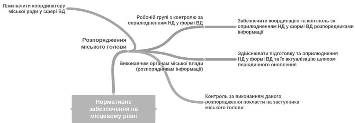
Рис. 2. Актуалізація наборів відкритих даних на прикладі розпорядження міського голови.

У подальшому треба підтримувати оприлюдненні набори даних в актуальному стані шляхом періодичного оновлення. Дуже цікавим є пропозиція Вінницької міської ради ввести посаду координатора міської ради у сфері відкритих даних (рис. 2).